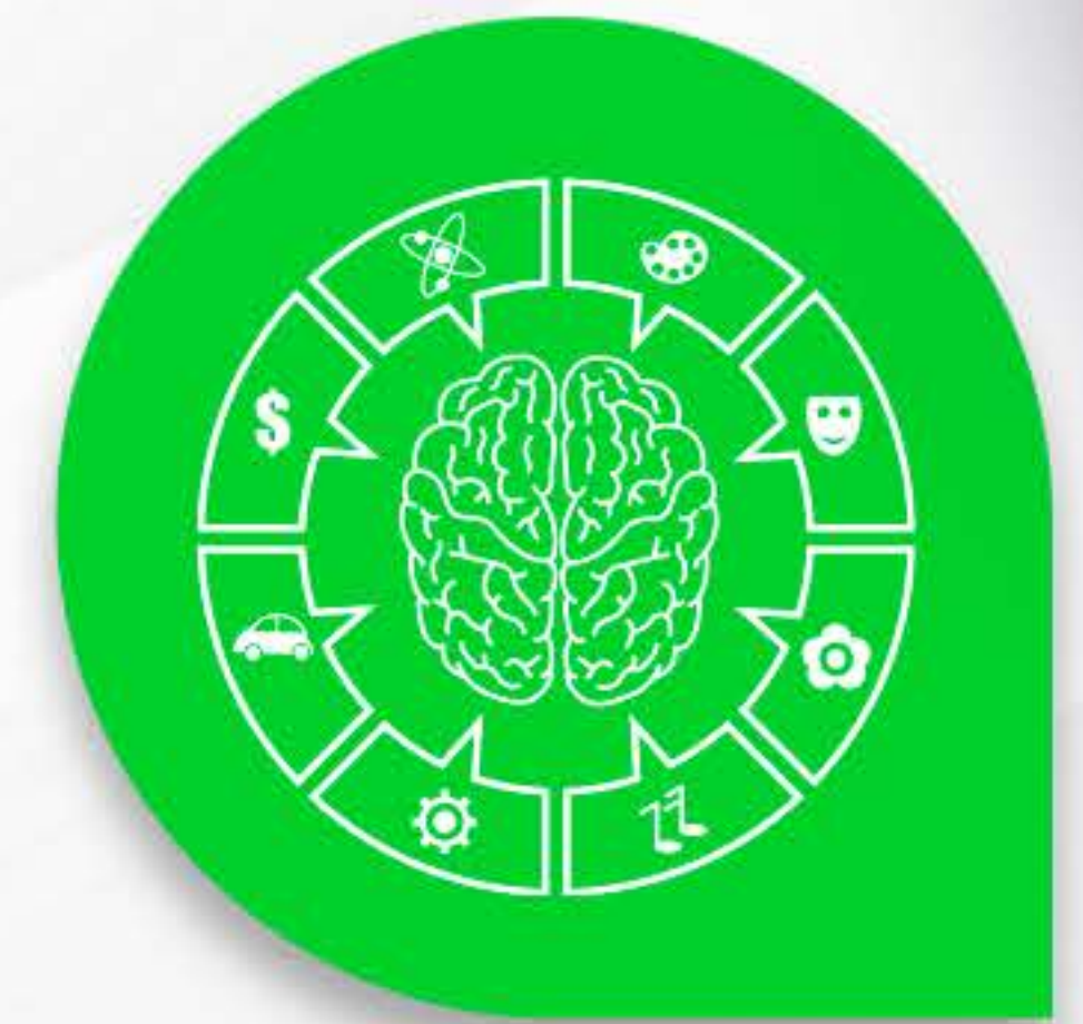
Teoria das Inteligências Múltiplas