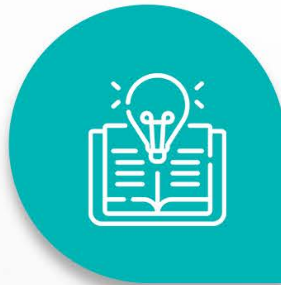
Psicologia do Desenvolvimento e Aprendizagem