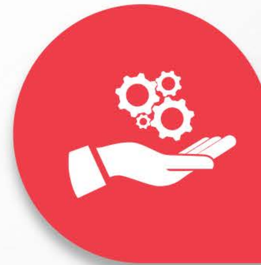
Metodologias Ativas: resolução de problemas e aprendizagem autônoma e participativa.