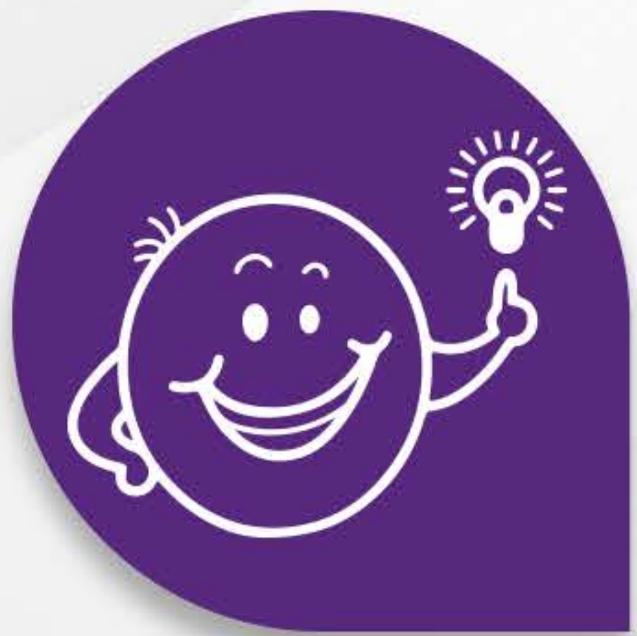
Teoria da Inteligência Multifocal – TIM

O curso SOMOS GÊNIOS SOCIOEMOCIONAL tem como principais fundamentações teóricas: