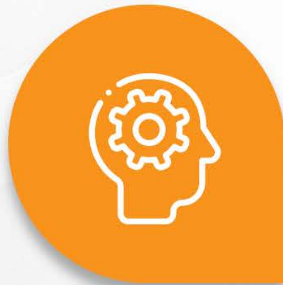
Psicologia Cognitivo Comportamental